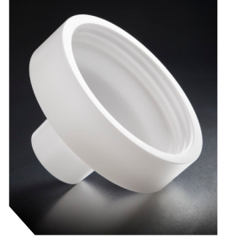
Тримач для бутлів