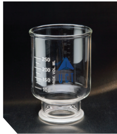
Воронка, 47 мм, 300 мл