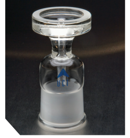
Базовий тримач, 47 мм