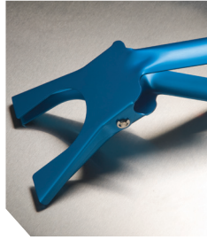
Алюмінієвий зажим, 90 мм