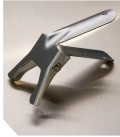
Алюмінієвий зажим, 47 мм