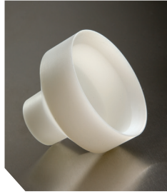
Тримач для пляшок