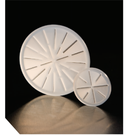
47мм/90мм сито KEL-F