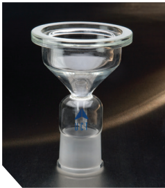
Базовий тримач, 90 мм