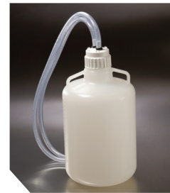
Контейнер для зливів