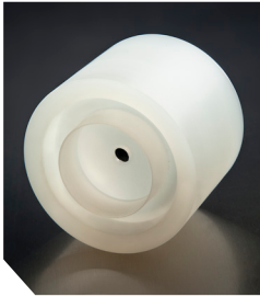
Універсальний адаптер для картриджів