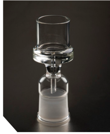
Скляний адаптер для картриджів