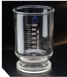
Воронка, 90 мм, 1000 мл